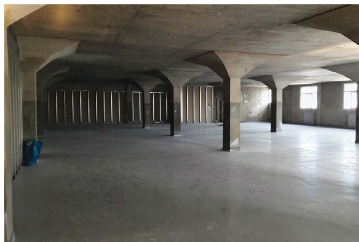
ΑΠΟΨΗ ΤΟΥ ΕΣΩΤΕΡΙΚΟΥ ΧΩΡΟΥ ΠΡΙΝ ΑΠΟ ΤΗΝ ΑΛΛΑΓΗ ΧΡΗΣΗΣ.