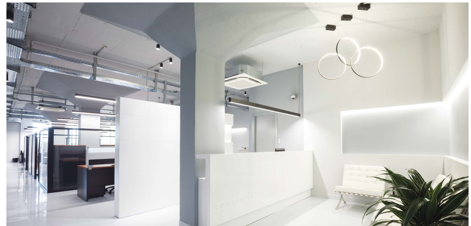
ΒΑΣΙΚΑ ΧΑΡΑΚΤΗΡΙΣΤΙΚΑ ΤΟΥ ΧΩΡΟΥ ΕΙΝΑΙ ΤΟ ΜΕΓΑΛΟ ΒΑΘΟΣ, Ο ΠΕΡΙΟΡΙΣΜΕΝΟΣ ΑΡΙΘΜΟΣ ΑΝΟΙΓΜΑΤΩΝ ΚΑΙ Ο ΑΥΣΤΗΡΟΣ ΚΑΝΝΑΒΟΣ ΥΠΟΣΤΥΛΩΜΑΤΩΝ ΜΕ ΤΙΣ ΧΑΡΑΚΤΗΡΙΣΤΙΚΕΣ ΑΠΟΛΗΞΕΙΣ.

Είναι σημαντικό το γεγονός ότι παρά τις επί μέρους επεμβάσεις που έχουν υλοποιηθεί στο κελύφος του κτιρίου και το γεγονός ότι η επανάχρησή του συντελέστηκε σχετικά αποσπασματικά στο εσωτερικό του, η αρχική