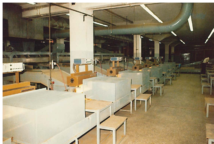
Ο ΕΣΩΤΕΡΙΚΟΣ ΧΩΡΟΣ ΜΕ ΤΟ ΜΗΧΑΝΟΛΟΓΙΚΟ ΕΞΟΠΛΙΣΜΟ ΕΠΕΞΕΡΓΑΣΙΑΣ ΚΑΠΝΟΥ.