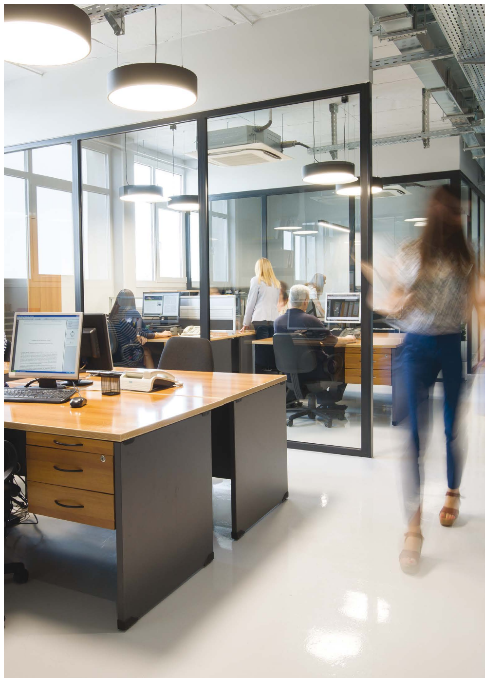
Η ΑΝΟΙΧΤΗ ΚΑΤΟΨΗ ΣΤΟΧΕΥΕΙ ΣΤΗΝ ΑΞΙΟΠΟΙΗΣΗ ΤΟΥ ΦΥΣΙΚΟΥ ΦΩΤΙΣΜΟΥ, ΕΝΩ ΤΑΥΤΟΧΡΟΝΑ ΑΠΟΔΙΔΕΙ ΣΗΜΑΝΤΙΚΟ ΒΑΘΜΟ ΕΥΕΛΙΞΙΑΣ ΟΣ ΠΡΟΣ ΤΗ ΔΙΑΤΑΞΗ ΤΩΝ ΕΝΟΤΗΤΩΝ ΤΩΝ ΓΡΑΦΕΙΩΝ.

Ο ΣΤΑΤΙΚΟΣ ΦΟΡΕΑΣ ΤΟΥ ΚΤΙΡΙΟΥ ΚΑΙ Ο ΚΑΝΝΑΒΟΣ ΤΩΝ ΕΛΕΥΘΕΡΩΝ ΥΠΟΣΤΥΛΩΜΑΤΩΝ ΔΙΝΕΙ ΡΥΘΜΟ ΣΤΟ ΧΩΡΟ ΚΑΙ ΟΡΓΑΝΩΝΕΙ ΤΗ ΔΙΕΛΕΥΣΗ ΤΩΝ ΔΙΚΤΥΩΝ ΜΕ ΥΠΟΔΟΜΕΣ, ΟΙ ΟΠΟΙΕΣ ΠΑΡΑΜΕΝΟΥΝ ΕΜΦΑΝΕΙΣ. ΤΑΥΤΟΧΡΟΝΑ ΟΙ ΓΥΑΛΙΝΕΣ ΕΠΙΦΑΝΕΙΕΣ ΚΑΙ ΤΟ ΛΕΥΚΟ ΒΙΟΜΗΧΑΝΙΚΟ ΔΑΠΕΔΟ ΣΥΜΒΑΛΛΟΥΝ ΣΤΗ ΦΩΤΕΙΝΟΤΗΤΑ ΤΟΥ ΧΩΡΟΥ.