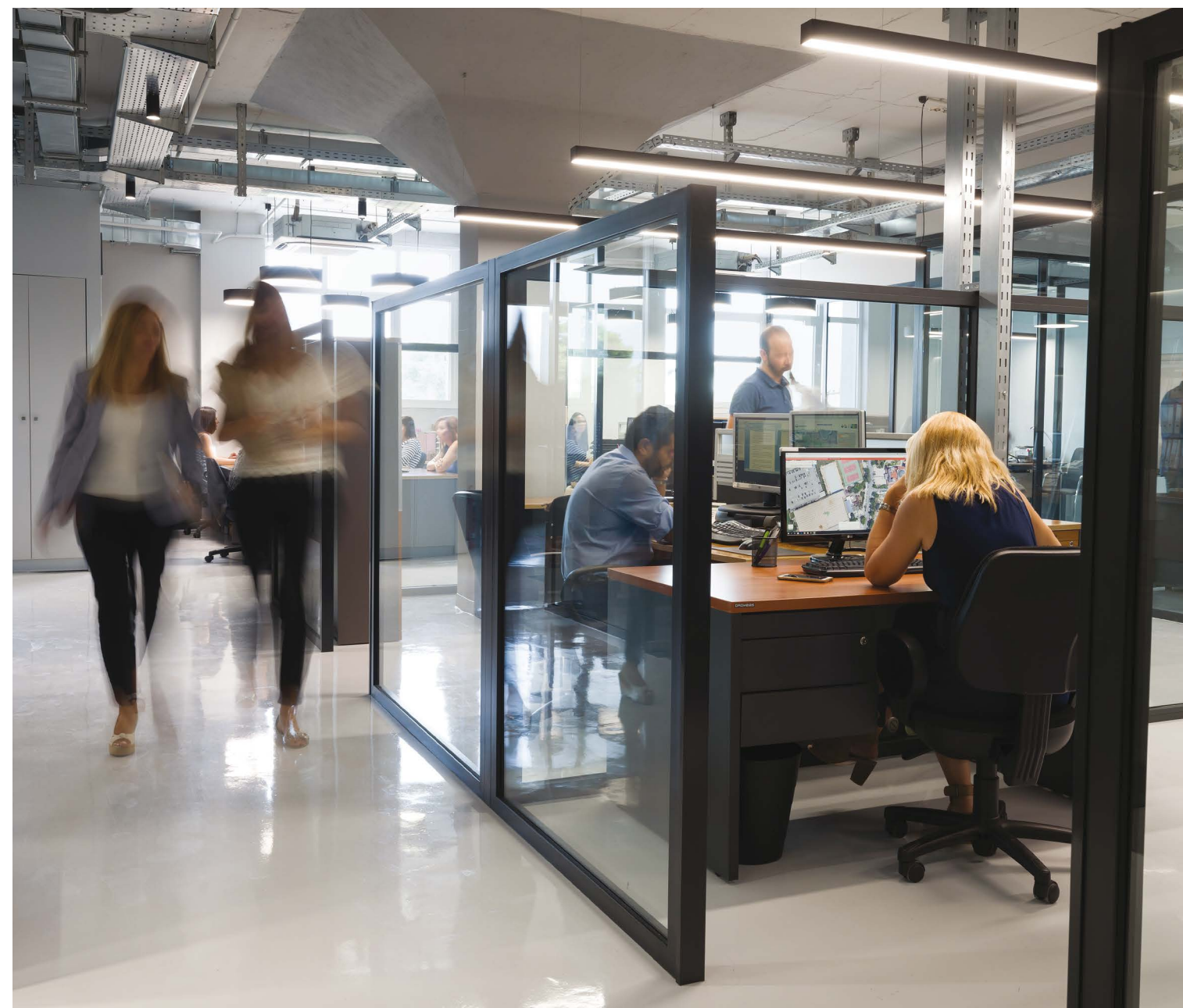
ΣΤΟ ΧΩΡΟ ΕΦΑΡΜΟΣΤΗΚΑΝ ΦΩΤΙΣΤΙΚΑ ΧΑΜΗΛΗΣ ΕΝΕΡΓΕΙΑΚΗΣ ΚΑΤΑΝΑΛΩΣΗΣ, ΣΥΣΤΗΜΑ ΚΛΙΜΑΤΙΣΜΟΥ ΜΕ ΑΝΤΛΙΑ ΘΕΡΜΟΤΗΤΑΣ VRV IV ΚΑΙ ΣΥΣΤΗΜΑ ΑΕΡΙΣΜΟΥ ΜΕ ΑΝΑΚΤΗΣΗ ΘΕΡΜΟΤΗΤΑΣ.

όψη) έχει μετατραπεί σήμερα σε πρόσοψη, καθώς έχει άμεση επαφή με την παρακείμενη λεωφόρο.